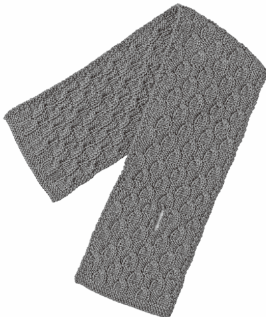
本体 (模様編み・ガーター編み)