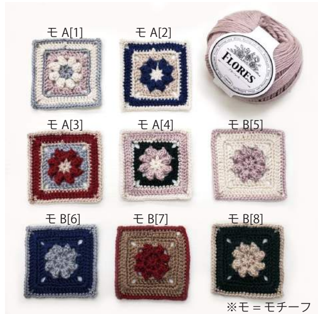
※モ = モチーフ