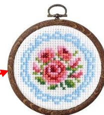
②刺しゅうキット No.7441 バラとレース