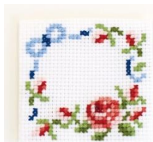
①刺しゅうキット No.9035 バラとリボン クロス・ステッチの 基本つき スターターキット

指定のクロス・ステッチキットに挑戦したらバラの花びらを赤く塗ろう！ 4枚花びらを埋めたらバラのぬりえが完成するよ♪