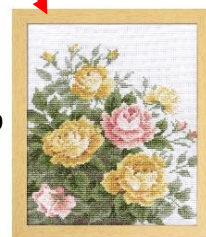
④刺しゅうキットNo.7449 イエローローズ 刺しごたえ十分！な 額の大作キット